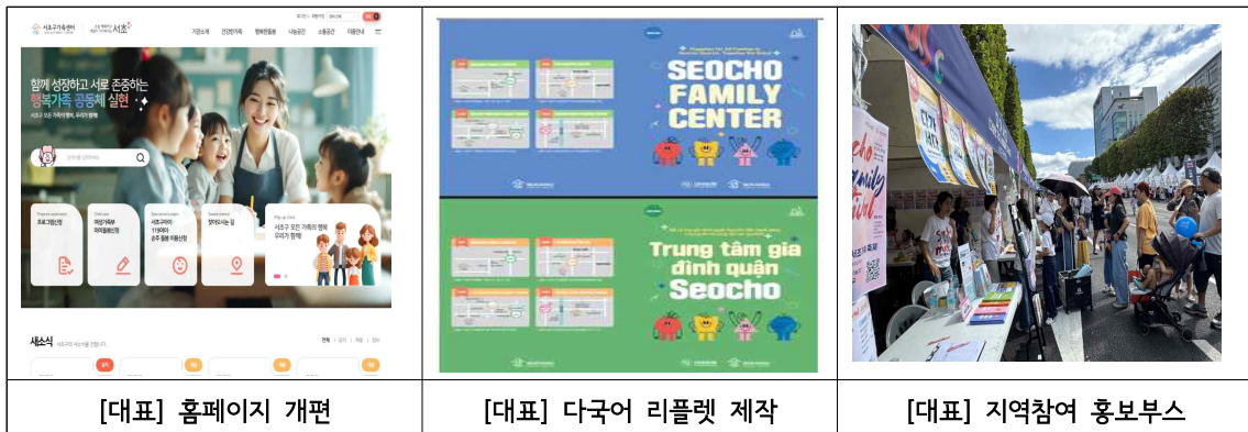
[대표] 홈페이지 개편