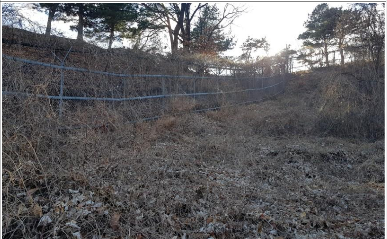
노후 철제 휀스