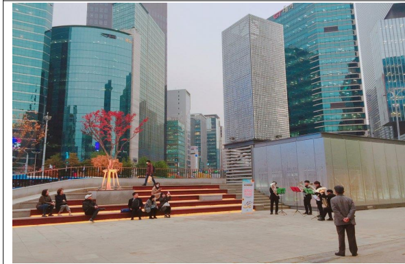
【사업 대상지 '서초 바람의언덕'】