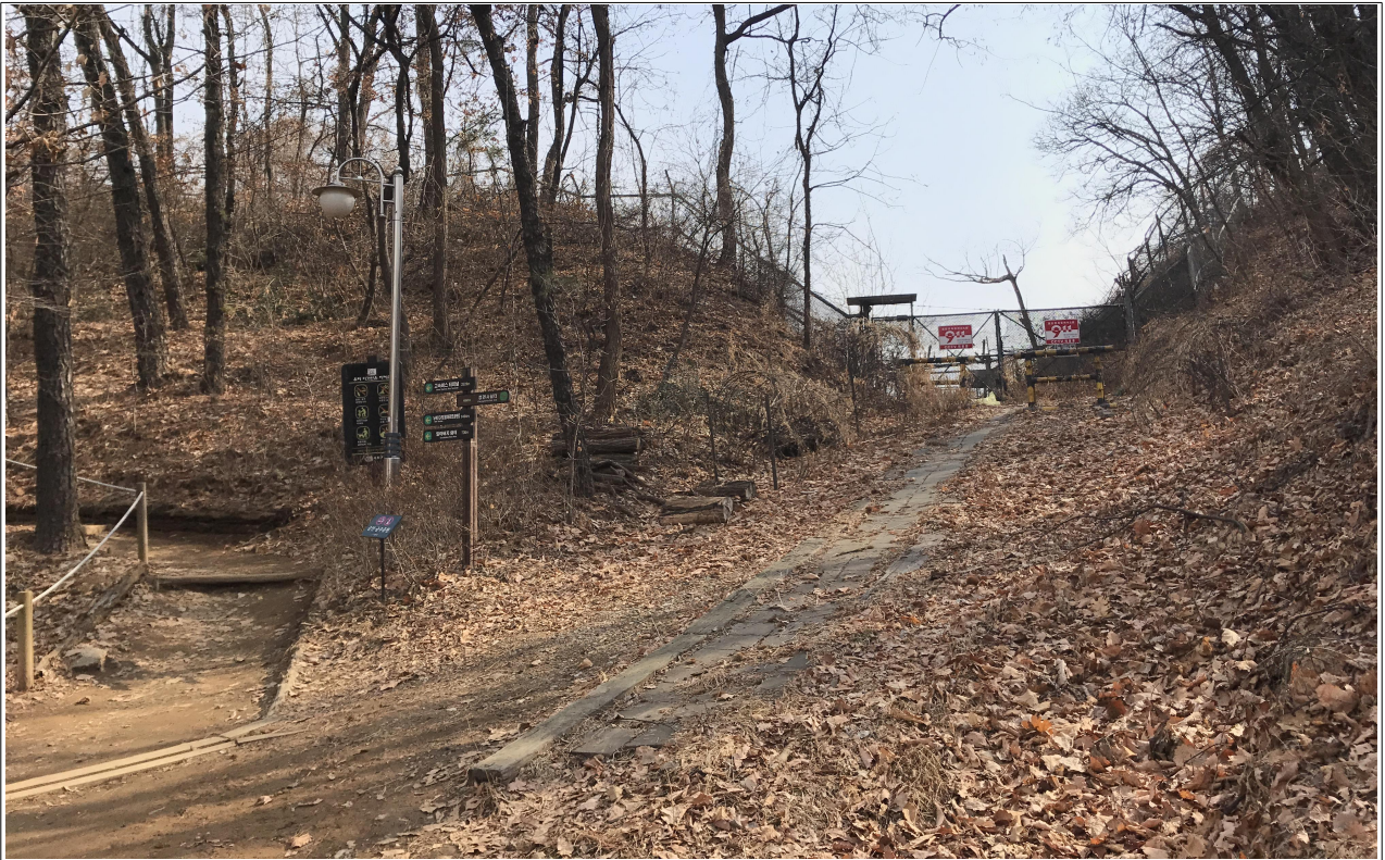
산책로 옆 바리게이트