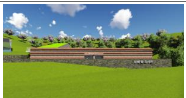
조 감 도