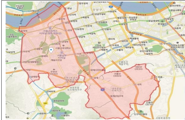
【위 치 도】