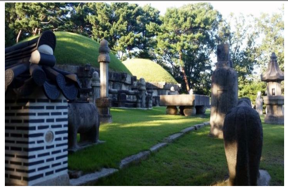
【사업 대상지 '헌인릉'】