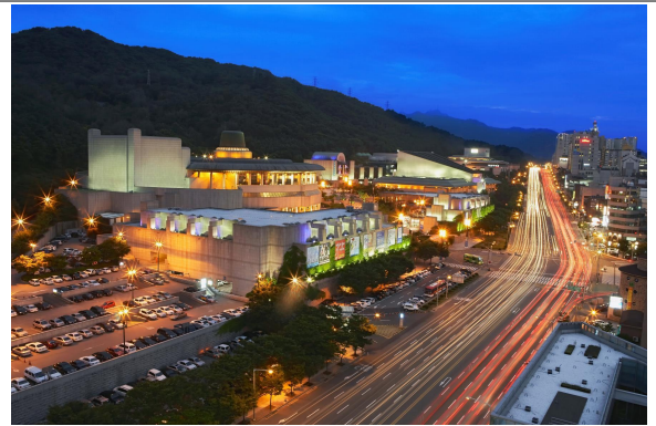
【사업 대상지 '예술의전당'】